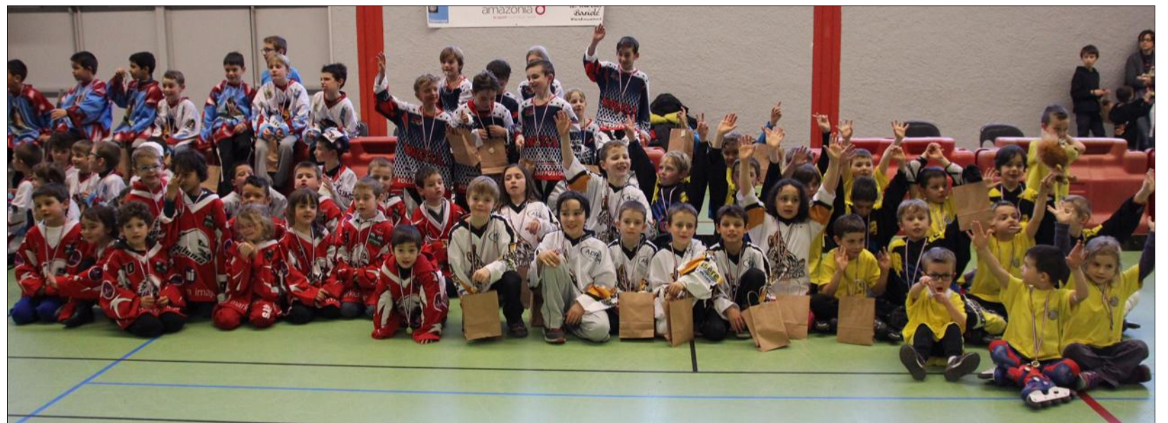
Soixante-neuf enfants de 4 à 8 ans ont participé à un tournoi jeunes de roller hockey au gymnase des Pies à Sassenage, samedi dès 9 h. Des clubs de toute la région Rhône-Alpes étaient représentés tels que celui de Valence, Crolles et Sassenage entre autres. À l'issue de cette manifestation sportive les enfants ont gagné une médaille et un sachet rempli de bonbons et petits jouets.