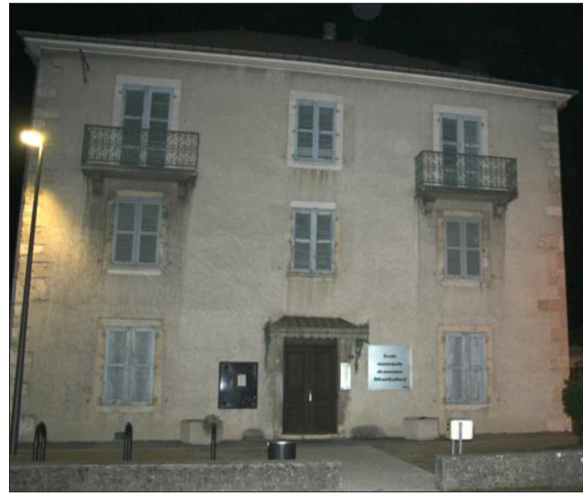
L'école de musique, devenue le conservatoire à rayonnement communal Alfred-Gaillard, accueille aujourd'hui près de 400 élèves.